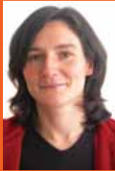
Von Stefanie Henneke und Katja Sauer

Ein Leitantrag des „alten“ Landesvorstandes, zahlreiche ergänzende und modifizierende Änderungsanträge aus den Orts- und Kreisverbänden, fast 3 Stunden spannende Debatten und an deren Ende eine breite Zustimmung der LDK-Delegierten in Hannover für die KOMMUNALPOLITISCHE ERKLÄRUNG . Damit hat der Parteitag die Grundlage für den Kommunalwahlkampf 2011 gelegt. In dem LDK-Beschluss sind zentrale Themen und Positionen der Grünen Kommunalpolitik für die kommenden 5 Jahre zusammengefasst, an ihm entlang werden nun die Wahlprogramme vor Ort entstehen. Und die werden den Wählerinnen und Wählern viele gute Gründe liefern, um in den Räten und Kreistagen für mehr Grün zu stimmen.