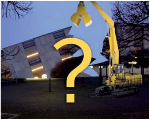
Niedersächsischer Landtag: Abriss des Plenarsaals? (Collage)

Aus den Ruinen des Welfenschlosses schuf der Architekt Dieter Oesterlen in den sechziger Jahren mit dem niedersächsischen Landtag einen Bau, der heute auch an die Geschichte einer jungen Demo-