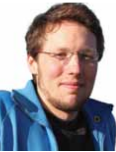
Jan Philipp Albrecht